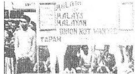
Penentangan terhadap Malayan Union