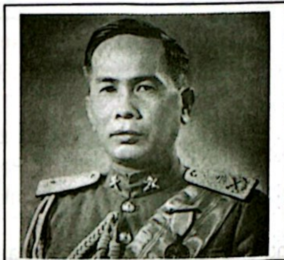
Field Marshall Phibulsongkram