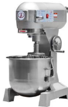
Mesin pengadun industri

Pernyataan yang manakah betul berkaitan gambar di atas?