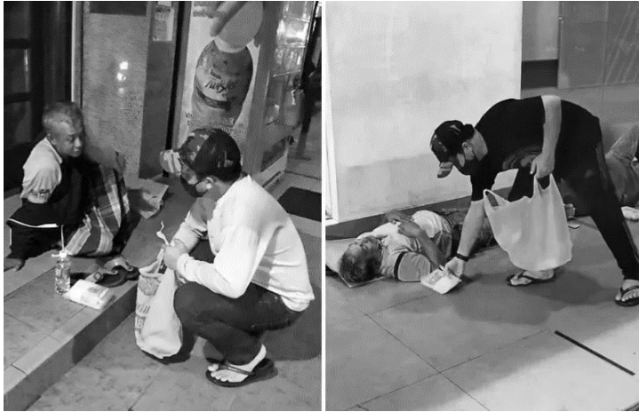
Bantuan kepada gelandangan

1. Gambar di bawah berkaitan perlakuan yang diamalkan oleh masyarakat Malaysia.