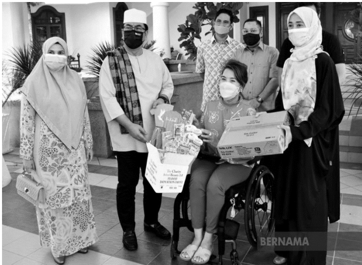
Bantuan kepada golongan kurang upaya