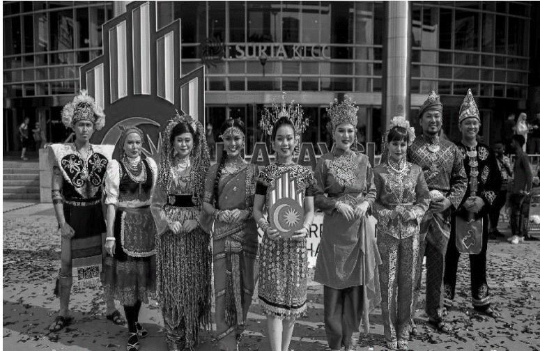
Pelbagai kaum dan keunikan pakaian tradisional

6. Gambar di bawah berkaitan keunikan rakyat Malaysia yang berbilang kaum.